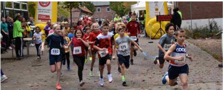
Die beigefügte Aufnahme entstand beim Start zum Schülerlauf aus dem Vorjahr.